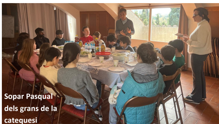
Sopar Pasqual dels grans de la catequesi