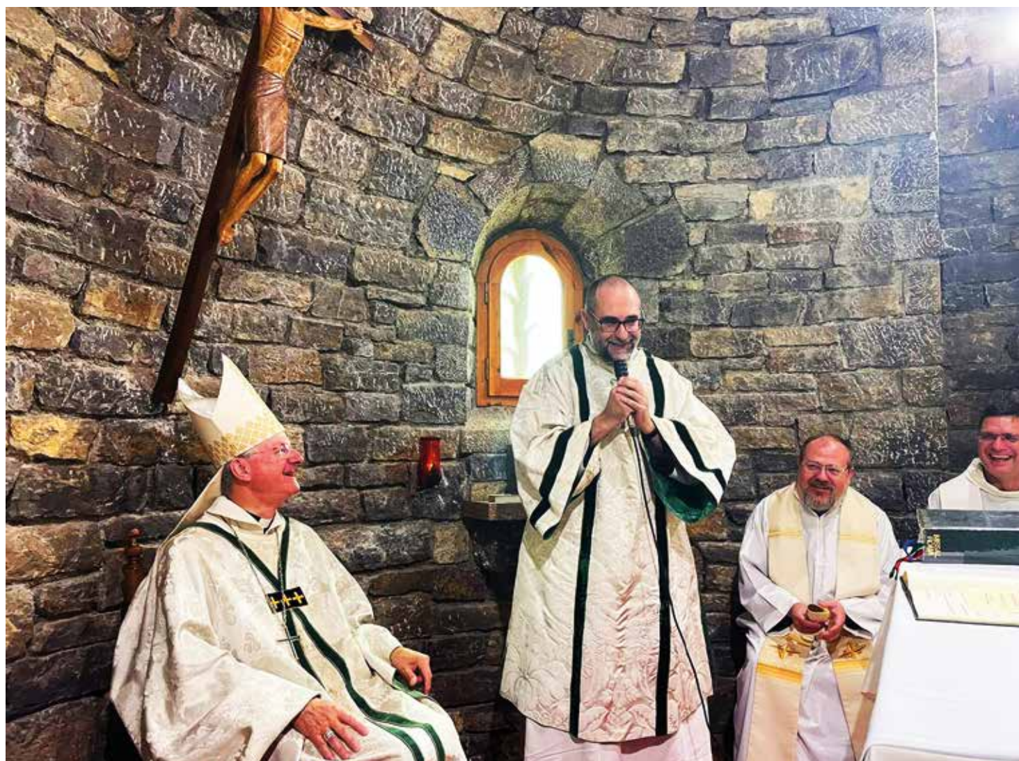
FOTO: Cerimònia d'ordenació com a diaca, el passat mes de juliol.

El dret a la llibertat religiosa és fonamental, cadascú ha de poder viure en llibertat les seves creences