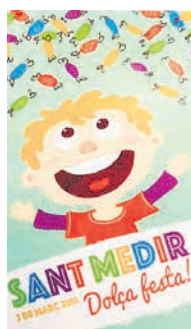
Cartel·l guanyador del concurs 2016

El guarniment de la Tapisseria Pons, que va obtenir el segon premi del concurs, es va basar en un pessebre.