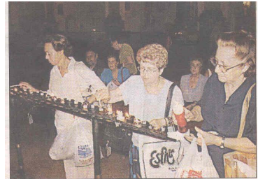
Se encendieron muchas velas para el santo.