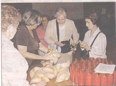
Los panes y velas, muy solicitados por los fieles.

El padre Turull destacó que «los mallorquines siguen la costumbre de adquirir los panes y también de encenderle velas a este santo franciscano», reconocido predicador y benefactor de los pobres que nació en Lisboa.